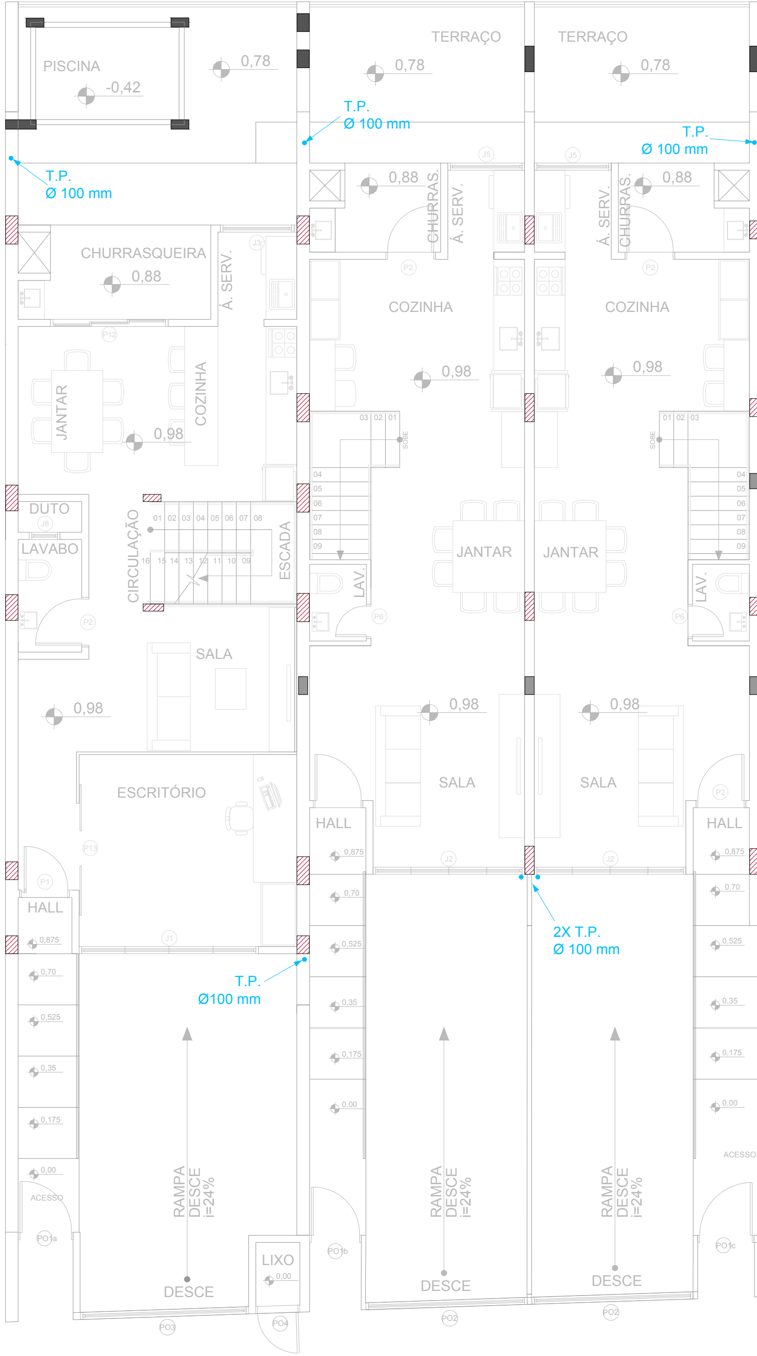
Térreo Nível + 98